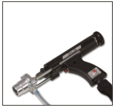
PH-3N螺柱焊枪是BMK-12W的标准配置焊枪。