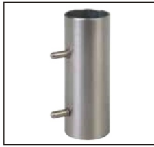
应用案例： 机械机构件